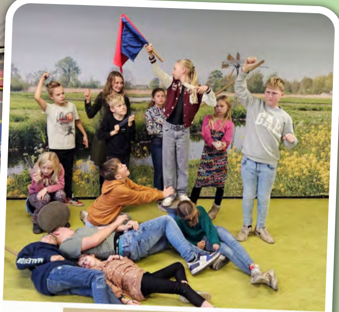
tableau vivant "De vrijheid leidt het volk"